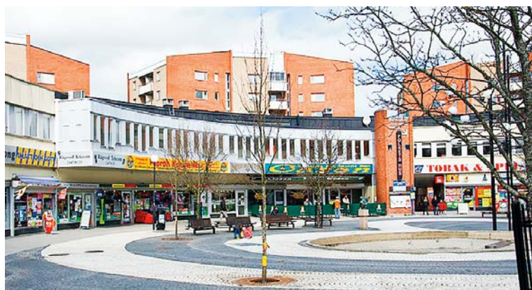
Höstmöte hålls i Rågsveds Folkets hus, Rågsvedstorget 11. T-bana Rågsved.