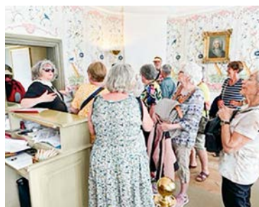
Bilder från den hemliga resan som i år gick till Uppsala. Bland annat med besök i Uppsala domkyrka.