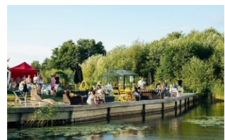
Besökt Hornudden Egen ekologisk odling