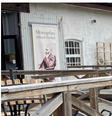
Hemliga resan "Ut i det blå" 2023

Våra populära resor med intressanta utflyktsmål fortsätter vi med under 2024, en av dessa brukar vara en hemlig resa som vi kallar "Ut i det Blå". Vi har studiebesök under året som vi försöker göra efter önskemål från våra medlemmar.