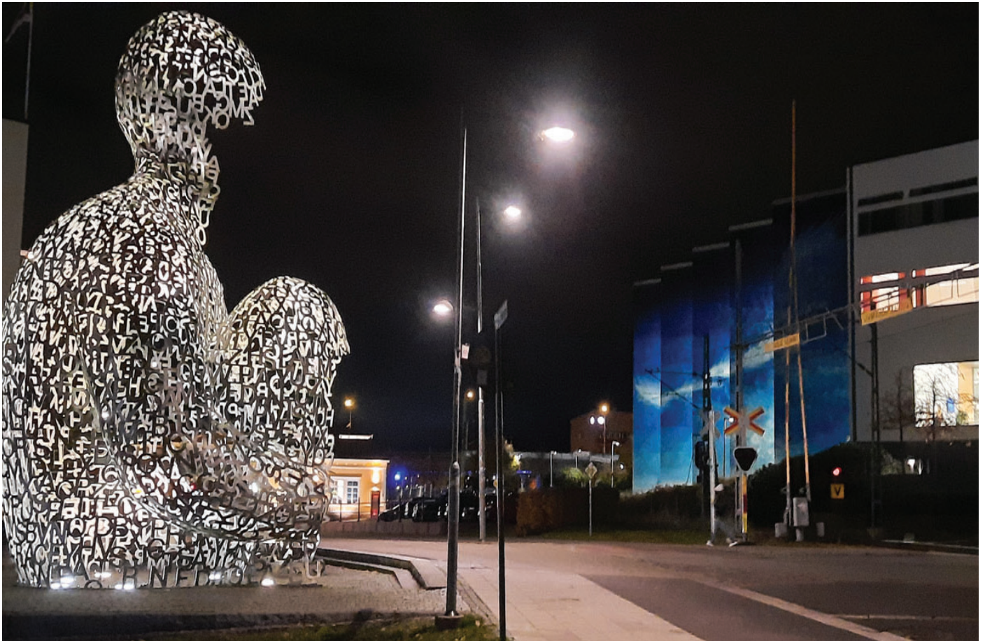
House of knowledge.